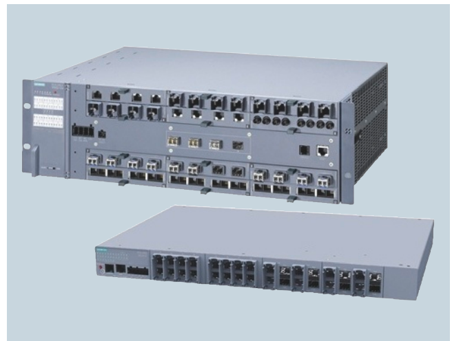
Die Industrial Ethernet Switches SCALANCE XR-500 bieten mit ihrem modularem Aufbau bis zu 52 Ports – wahlweise elektrisch und optisch gemischt – und bis zu vier 10 Gigabit-Ports zum Anschluss an den Core.

Siemens, aus der Automatisierungswelt kommend, kennt die Anforderungen industrieller Applikationen hinsichtlich Deterministik, zyklischem Datenverkehr, Motion Control und funktionaler Sicherheit (Safety). Um diese Anforderungen in einem ethernetbasierten Netzwerk zu erfüllen, startete Siemens bereits Mitte der 80er-Jahre mit dem SINEC H1-Bus in die Welt der ethernetbasierten Kommunikation („Yellow-Cable“). SINEC H1 ist ein Kommunikationsnetz für den Zellenbereich in Basisbandübertragungstechnik gemäß IEEE 802.3 mit Zugriffsverfahren CSMA/CD und mit Vernetzung über Triaxial-Busleitung (H1) und Punkt zu Punkt über Lichtwellenleiter und Sternkoppler (H1FO). Heute dienen Industrial Ethernet Switches der SCALANCE X-Produktfamilie in verschiedenen Leistungsklassen mit einer Bandbreite von bis zu 10 Gbit/s einem zuverlässigen und robusten Netzwerk in der Automatisierungslandschaft.