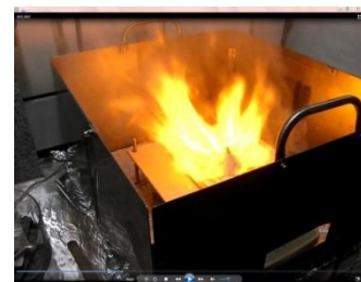
Bestimmung der brandfördernden Eigenschaften (UN 0.3)