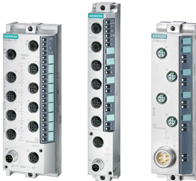
図. ET 200eco PN シリーズ外観