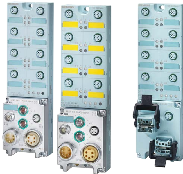
図. ET 200eco シリーズの外観