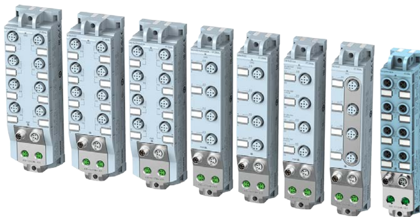
図. ET 200AL シリーズ外観